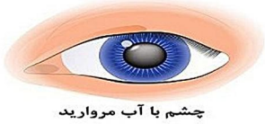
چشم با آب مروارید