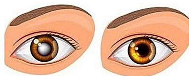
چشم دارای آب سیاه